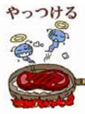
資料：政府広報オンラインお役立ち情報

清潔な手で調理をするのは基本ですが、煮込み料理を作るときは①料理を常温で放置せず早く冷蔵庫に保管(菌を増やさない)②食べる直前に75℃で1分間以上加熱(殺菌する)などが大切です。