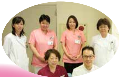
倉敷成人病センター