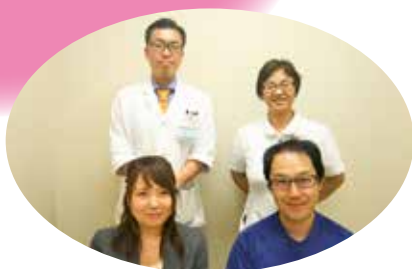
川崎医科大学附属病院

現在、倉敷中央病院と共同でリハビリを含めた「心不全」の治療がより円滑に行っています。仕組みづくりを行っています。(次号で詳しく紹介します。)