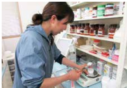
薬の計量作業をする筆者

当院では、職場間の連携や理解を深める目的で職場体験を行っています。今回は、薬剤師体験のレポートをご紹介します。